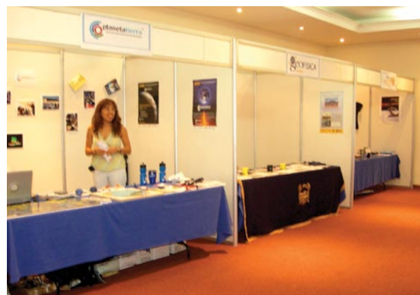
Entidades universitarias participaron con stands para promover sus publicaciones y servicios académicos