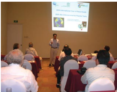
Durante las presentaciones orales

En una de las sesiones de exposición de carteles. (abajo) imágenes de la Sesión Especial Ciencias de la Tierra y Sociedad