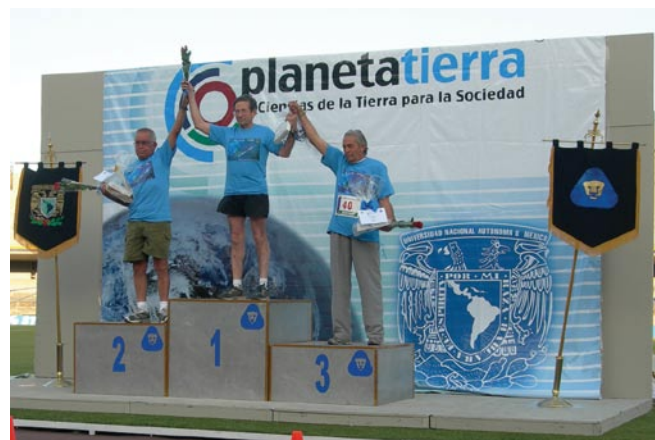
Aquí los primeros lugares en la categoría Pre-cámbrico