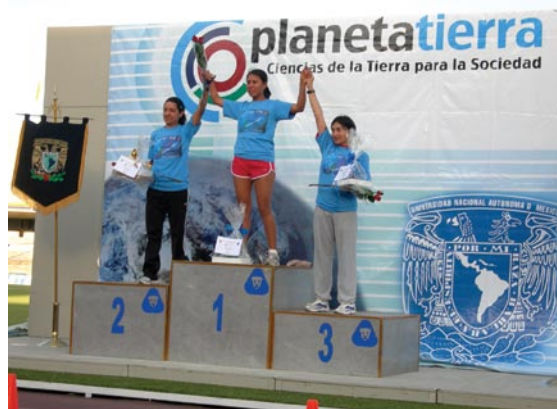
Las triunfadoras en la categoría Cenozoico