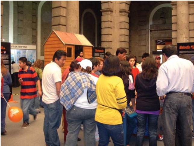
En el patio principal del Palacio de Minería los visitantes apreciaron la exposición interactiva La Furia de la Tierra.