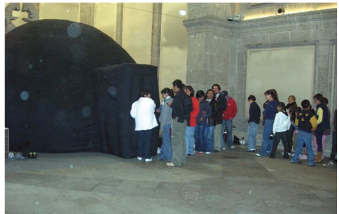
En la imagen (arriba) los visitantes ingresan al Planetario Portatil de Ciencias de la Tierra.

Los asistentes tuvieron la oportunidad de apreciar las exposiciones: Bajo el volcán, elaborada por especialistas de Universum y del IGEF; Riqueza minera, del Instituto de Geología; Tesoros de la madre Tierra, del Instituto de Geología; la exposición de litografías de Claudio Linati; los carteles de áreas naturales protegidas y conocimiento de la biodiversidad, del Instituto de Biología, además de la colección de primeros instrumentos de medición del Instituto de Geofísica.