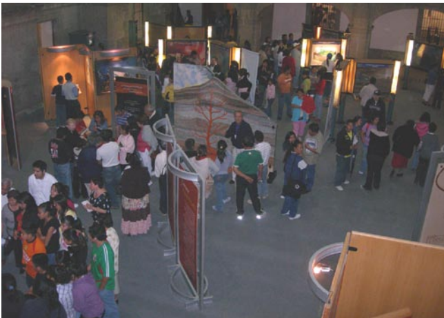
En otro de los patios un aspecto de la exposición Bajo el Volcán.