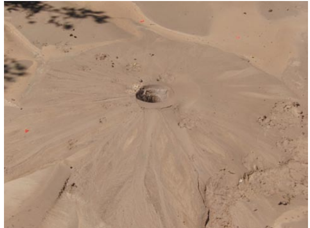
En la imagen orificio por donde salió material de grano fino y agua, localizado en el ejido Oaxaca, municipio de Mexicali.

El Comité Científico que visitó la zona afectada, en la semana del 6 al 9 de abril, determinó que la presencia de agua surgida con el sismo se debió a fenómenos de licuefacción, a causa de lo somero del agua subterránea, 2 a 4 metros de profundidad, y a la presencia de material de grano fino en la composición geológica de los suelos de la zona. El agua que brotó inundó parcialmente varias comunidades agrícolas del Sur del Valle de Mexicali.