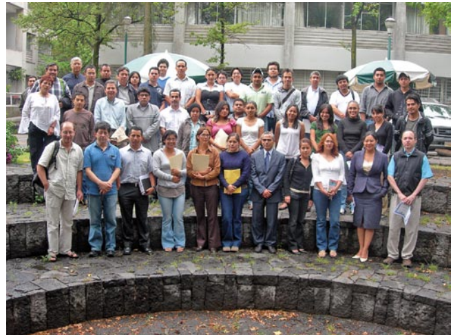
Algunos participantes en la I Reunión de la Red Iberoamericana para el Monitoreo y Modelización de Cenizas y Aerosoles Volcánicos.

La agenda de esta primera reunión contempló la presentación de trabajos realizados por los vulcanólogos integrantes de esta Red, así como un Curso de Modelización de Cenizas y Aerosoles Volcánicos y la visita a observatorios mexicanos donde se realiza monitoreo ambiental, como la Red Automática de Monitoreo Ambiental (RAMA), la unidad móvil de monitoreo atmosférico del Centro de Ciencias de la Atmósfera de la UNAM y a las instalaciones del CENAPRED. ●