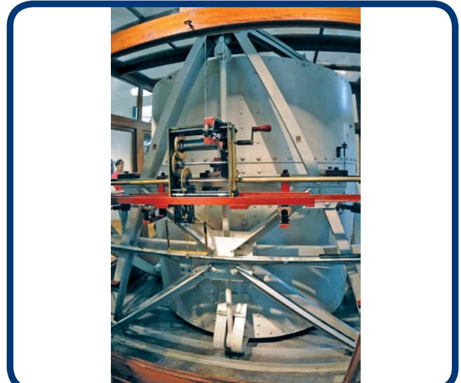
Sismógrafo Wiechert de 17000 kilogramos

Fundado por decreto presidencial el 5 de septiembre de 1910, el Servicio Sismológico Nacional (SSN) quedó bajo el cargo del Instituto Geológico Nacional dependiente de la Secretaría de Minería y Fomento. Inicialmente el Servicio Sismológico estaba compuesto por siete estaciones, incluyendo la estación central de Tacubaya.