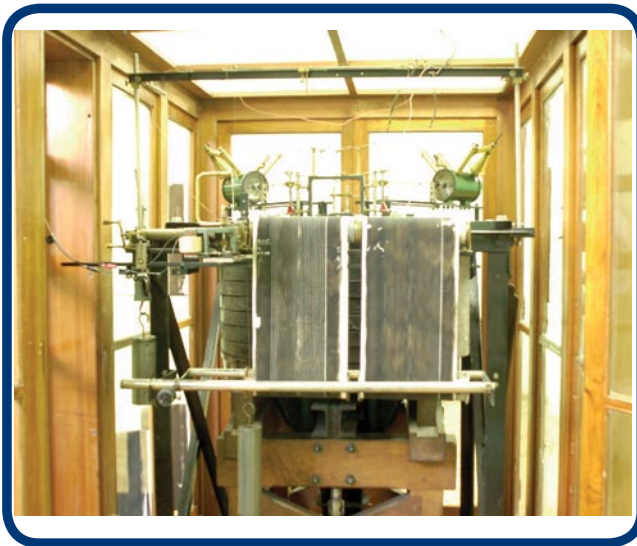
Sismógrafo Wiechert de 1200 kilogramos