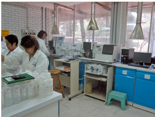
En el área de absorción atómica, al fondo el espectrofotómetro Perkin Elmer AAnalyst 200.