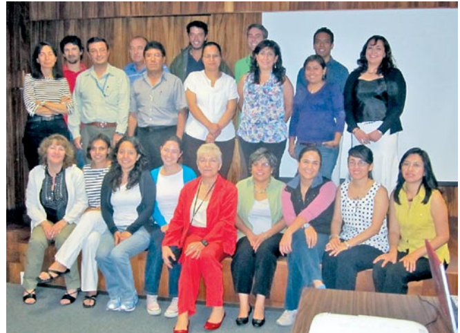
El equipo de investigación del proyecto Recursos geotérmicos submarinos del norte del Golfo de California.

Finalmente, informó la investigadora, otro de los resultados de este simposio fue encontrar la posibilidad de futuras colaboraciones con las entidades participantes. "Hay varias líneas de