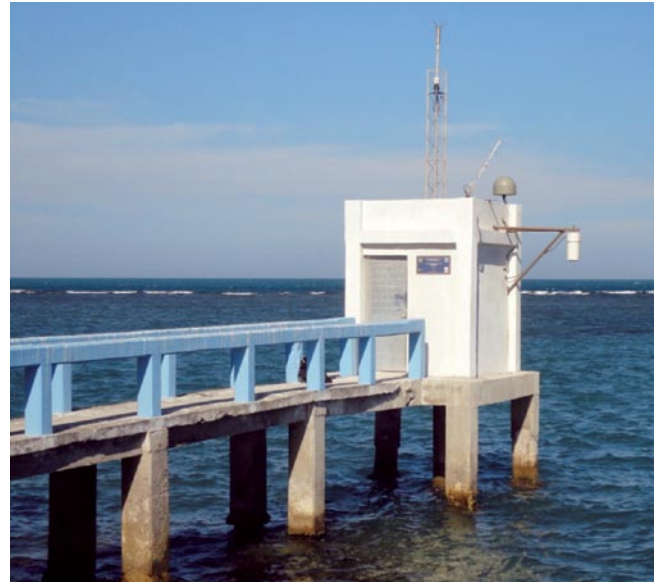
Estación de Veracruz equipada con sensores mareográficos, meteorológicos y GPS de alta precisión

Finalmente, el doctor Jorge Zavala Hidalgo, jefe del SMN, informó que la modernización de las estaciones que lo integran requiere la instalación de sensores meteorológicos y GPS de alta precisión. Además de digitalizar los mareogramas históricos, organizar bases de datos y colaborar con instituciones nacionales e internacionales. Dijo que: "Para contar con una alerta de tsunami confiable requerimos redes GPS de monitoreo en tiempo real".