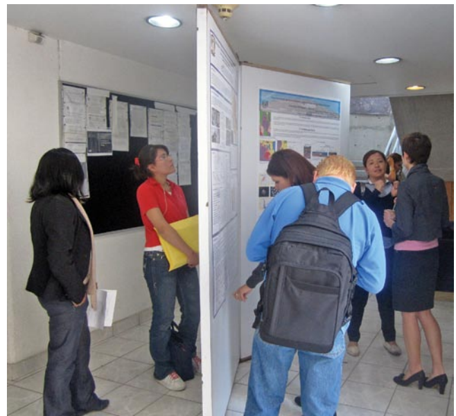
Durante la sesión de carteles referentes a la geocronología

Estudiar cómo ha pasado el tiempo en las rocas y yacimientos también es de gran utilidad para la búsqueda y el aprovechamiento de recursos naturales como el petróleo y las aguas subterráneas.