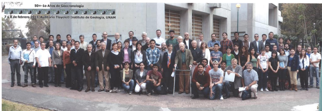
Algunos de los participantes al Simposio

Para celebrar la historia de la geocronología en México, académicos del Laboratorio Universitario de Geoquímica Isotópica (LUGIS) organizaron el Simposio 50 ± 1σ años de Geocronología en México , mismo que se llevó a cabo los días 7 y 8 de febrero en el auditorio Tlayotl del IGEF.