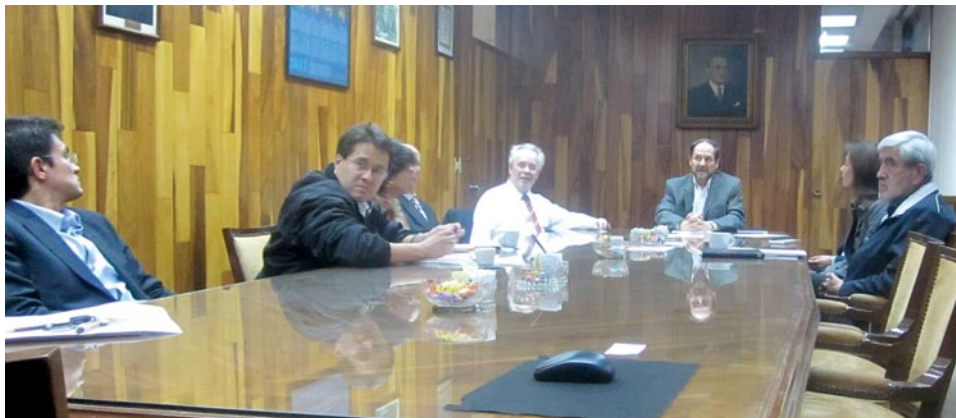
El doctor Donald B. Dingwell durante su visita al Instituto de Geofísica de la UNAM

En el mes de febrero, el doctor Donald Dingwell, secretario general del Consejo Europeo de Investigación (ERC, por sus siglas en inglés) visitó nuestro país con la intención de promover la colaboración entre México y Europa.