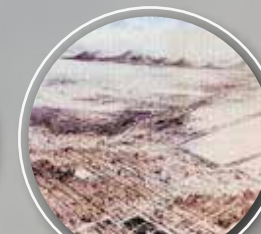
CD.MX. siglo XIX