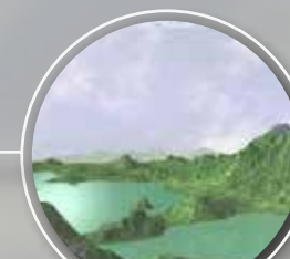
antiguo valle lacustre