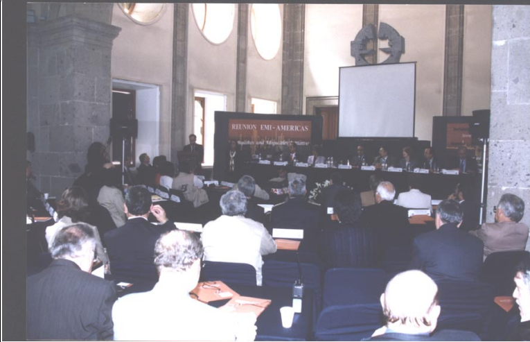
Imágenes de la Reunión Emi - Américas: Earthquakes and Megacities Initiative, organizada por el Gobierno del Distrito Federal.